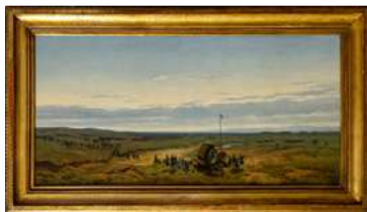
110 Carlo Piacenza (Torino, 3 dicembre 1814 - Castiglione Torinese, 1887)