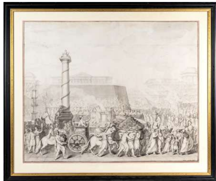
79 Carl Frederik Stanley (1738 circa - 9 marzo 1813)