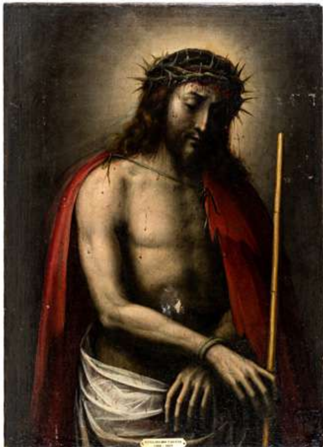
55 Scuola di Guglielmo Caccia (Montabone, 9 maggio 1568 - Moncalvo, 13 novembre 1625)