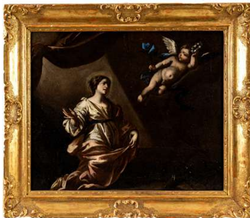
56 Nicolò de Simone attivo a Napoli tra il 1636 e il 1655