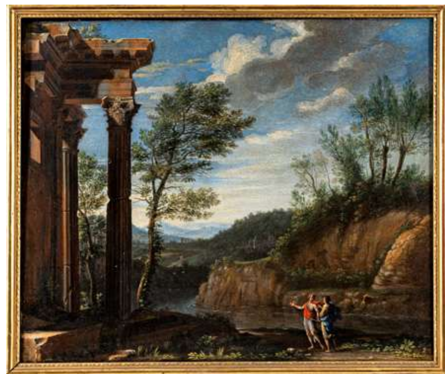
52 Scuola romana del XVIII secolo Architettura con rovine

Olio su tela 49 x 58 cm PROVENIENZA: Collezione privata, Vercelli