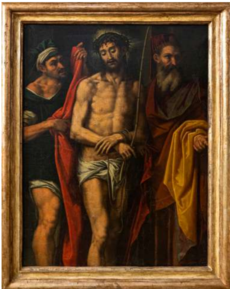
74 Scuola di Simone Peterzano (Venezia, 1535 - Milano, 1599)