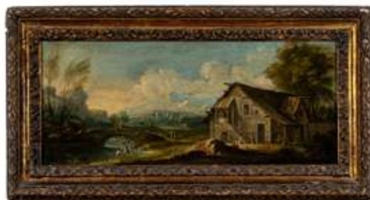
78 Domenico Pecchio (Casaleone, 20 maggio 1687 - Verona, 14 aprile 1760)