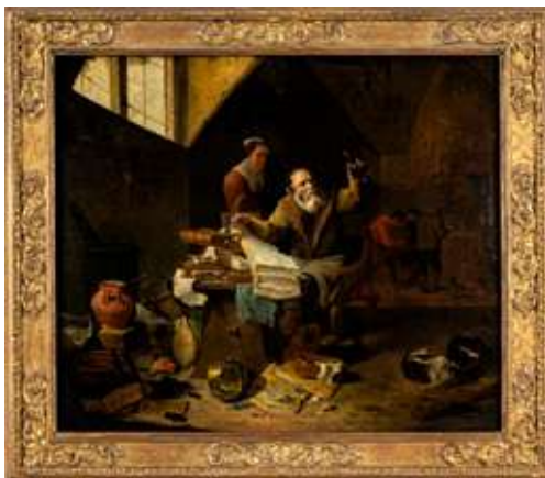
77 Mattheus van Helmont (Anversa, 1623 - Bruxelles, 1679 circa)