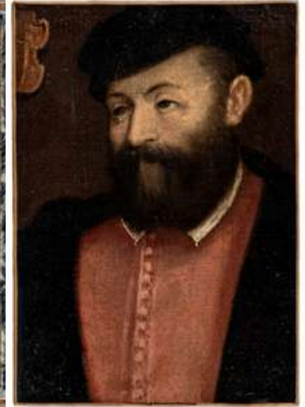
60 Scuola toscana del XVII secolo Ritratto di notevole

Olio su tela 43 x 30 cm PROVENIENZA: Collezione privata, Vercelli