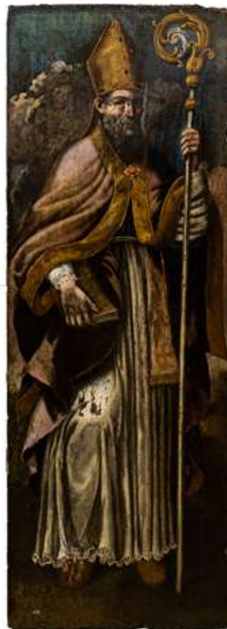
75 Scuola ossolana del XVI secolo