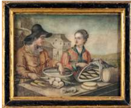
58 Scuola fiamminga del XVII secolo I cuochi

Tempera su pergamena 25 x 32 cm PROVENIENZA: Collezione privata, Vercelli