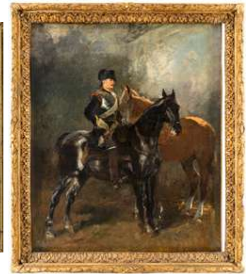
122 John Lewis Brown (Bordeaux, 16 agosto 1829 - Parigi, 14 novembre 1890)