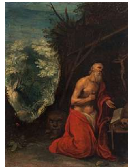
76 Scuola romana del XVII secolo