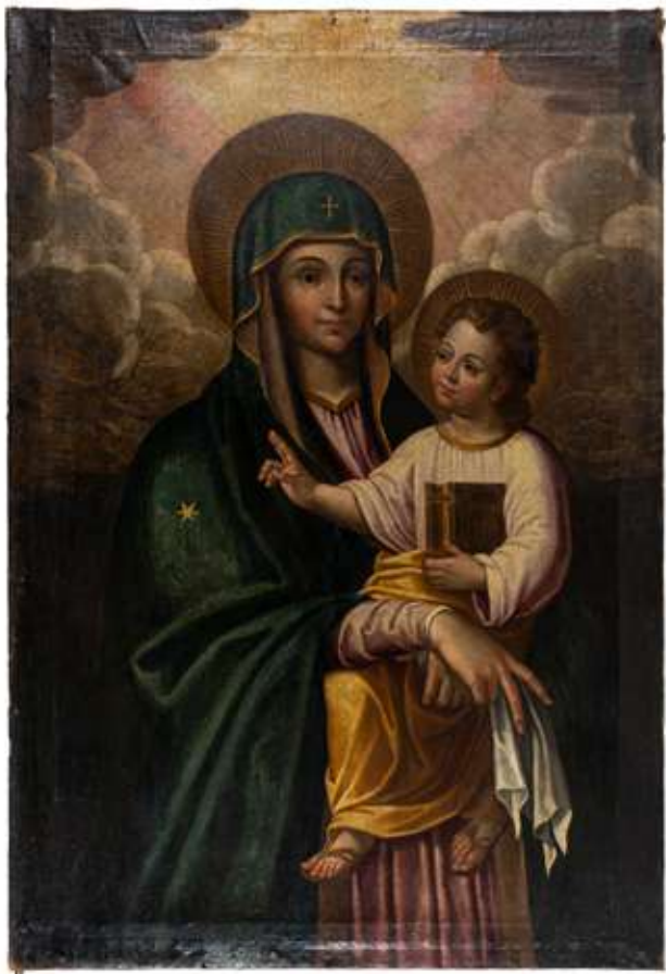
51 Girolamo Becucci detto Fra' Girolamo da Massa notizie dal 1637/1640