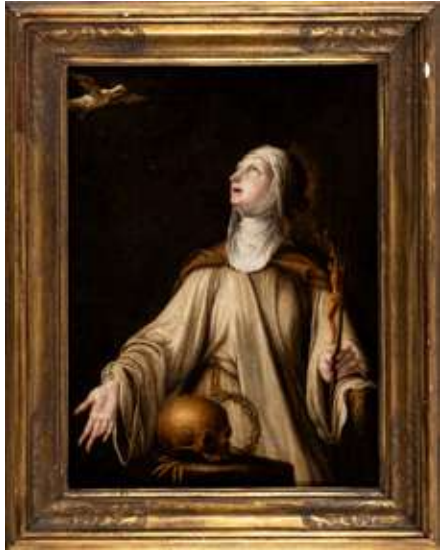
57 Scuola veneta del XVII secolo Estasi di Santa Caterina da Siena

Olio su tela 36 x 48 cm PROVENIENZA: Collezione privata, Vercelli