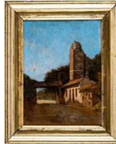
121 Carlo Nogaro (Asti, 1837 - Choisy-au-Bac, 1931)