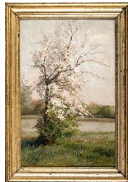
105 Carlo Nogaro (Asti, 1837 - Choisy-au-Bac, 1931)