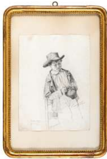
120 Carlo Nogaro (Asti, 1837 - Choisy-au-Bac, 1931)